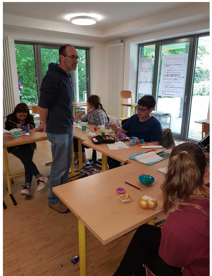
Die WP bei der Arbeit

Anschließend werden die Herzen verschenkt.