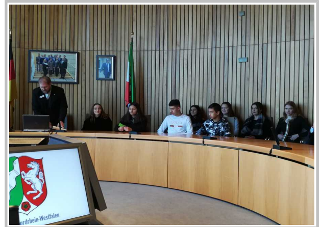
Im Landtag wurde diskutiert