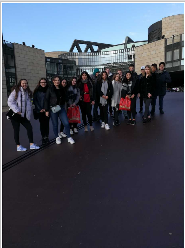
Vor dem Eingang des Landtages.