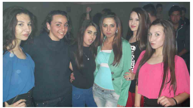
Cooler Mädchen und.....

So wurde bis zum Ende getanzt, gelacht und nochmals getanzt.