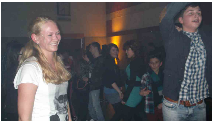
Auch Lehrerinnen hatten ihren Spaß!

Dazu beigetragen haben die Nebelmaschine und die neue Lasershow. Erstmals wurde die Bühne aufgebaut, auf der die Musikanlage stand und so der Eindruck einer richtigen Diskothek erweckt wurde.