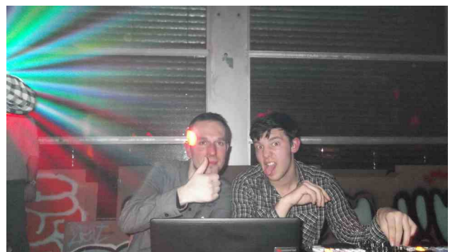
Diskjockeys bei der Arbeit