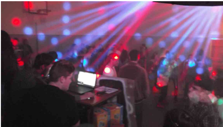
Alle waren sich einig: Tolle Lightshow!

Viele hatten sich schon darauf gefreut: Endlich wieder eine Schuldisco. Und die Vorfreude war nicht unbegründet, denn es war mal wieder eine gelungene Veranstaltung. Das Wichtigste dabei war, dass keine unschönen Zwischenfälle gab und alle Schüler ihren Spaß hatten.