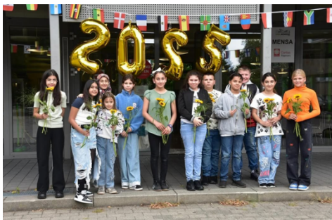
Abbildung 1 Einschulung Klasse 5

Im 28. August durften wir unsere neuen Fünftklässler:innen herzlich an unserer Schule willkommen heißen. Die Einschulungsfeier war ein schöner und lebendiger Start für die Kinder – ein besonderer Dank gilt allen Kolleg:innen und älteren Schüler:innen, die zur Gestaltung beigetragen haben.