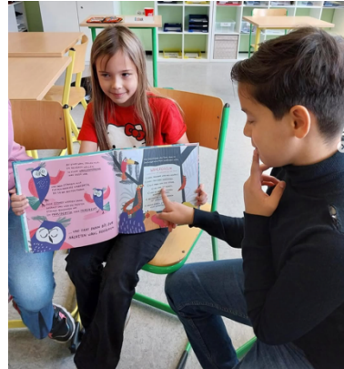
Abbildung 2: Demokratietraining

Weitere Schüler:innen sind über die Schulstation als Seiteneinsteiger:innen in die Karlschule gekommen. In den ersten Wochen haben sie erst einmal Vertrauen zu den Lehrkräften und Sozialarbeiter:innen aufbauen können, bevor sie alle ihren entsprechenden Klassen zugeteilt wurden und nun auch in ihren Klassen neue Freunde gefunden haben und weiter Lehrer:innen der Karlschule kennenlernen konnten.