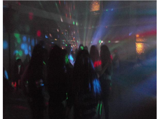
In der Turnhalle