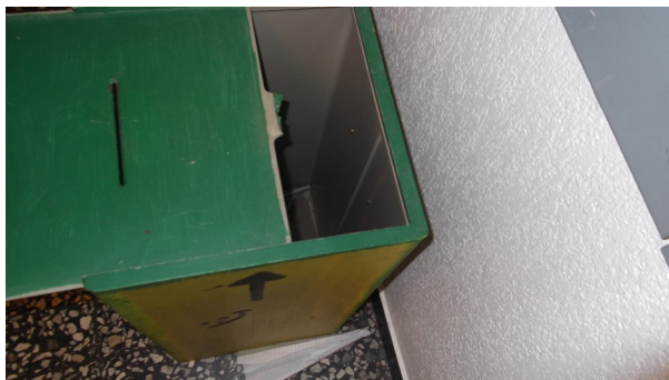
Zerstörter SV Kasten

Daher müssen wir ein neuen Kasten bauen, wir hoffen,dass es nie wieder vorkommt! Der neue Kasten kommt in den nächsten Tagen.