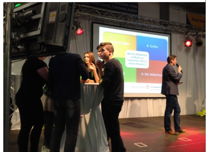
Allgemeinwissen wurde auch abgefragt.

Als alle Schulen gegeneinander angetreten waren, stand fest :