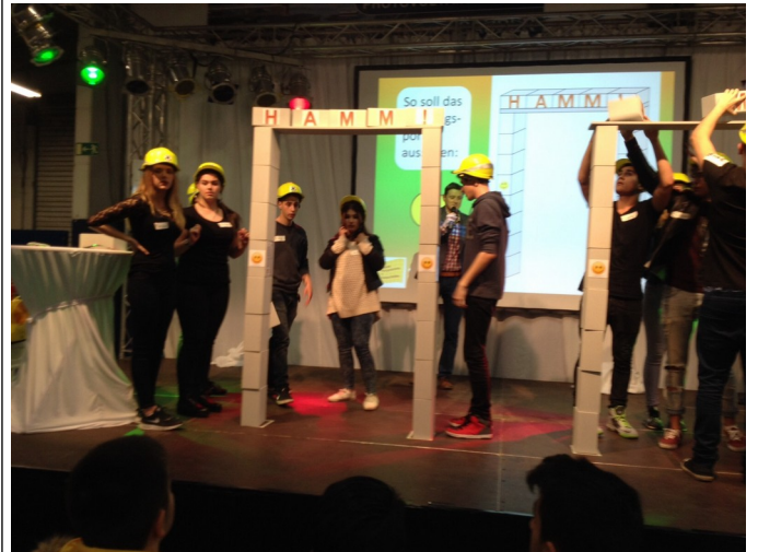
Die Schüler mussten so schnell wie möglich ein Tor bauen.

Darüber hinaus gab es noch ein Bildungsquiz, bei dem die verschiedenen Schulen gegeneinander antraten und viele Aufgaben bewältigen mussten. Neben Wissensfragen war auch handwerkliches Geschick gefragt.