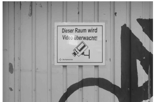
Das für "Täter" abschreckende Warnschild

-Sobald der Täter gefasst wird, wird er für die Schäden aufkommen müssen