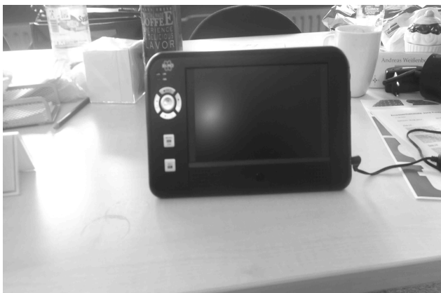
Brandneuer Monitor für die Kameras

Die SV hofft nun, dass mehr Schüler ihre Fahrräder im Fahrradkeller abstellen, da sie nun sicher sind.