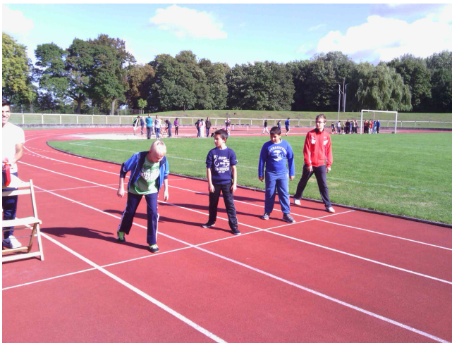
Vor dem 75m Lauf waren alle nervös

Bei herrlichem Sonnenschein konnten die Schüler ihr Bestes geben und zeigten vielfach überragende Leistungen.